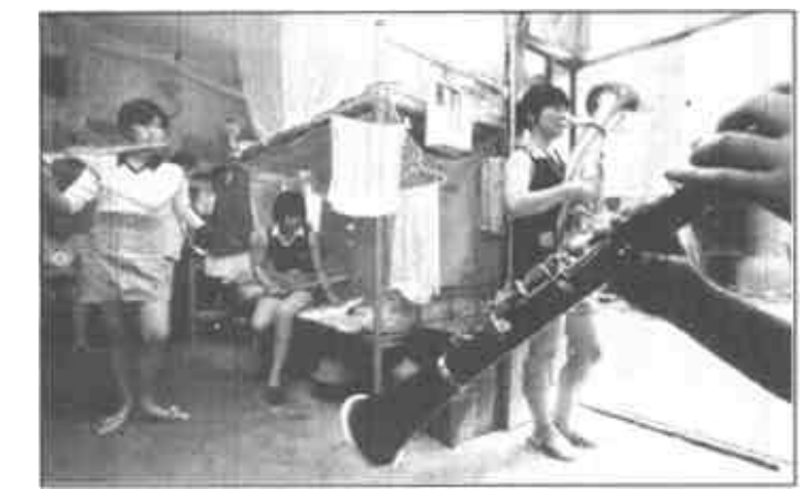
除了演出，乐手们每天要排练7个小时。