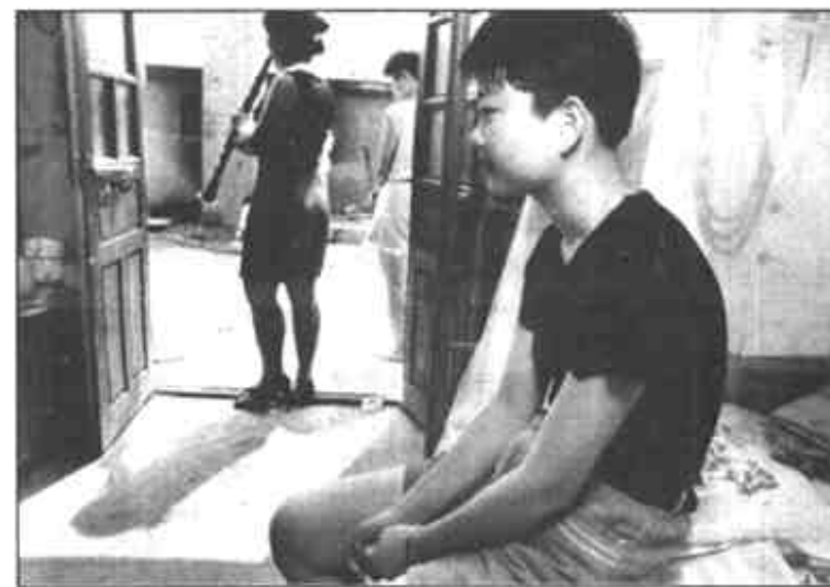
▶这位不愿透露姓名的菏泽姑娘对我说，来了一个多月，从来没有离开过父母，很想家。